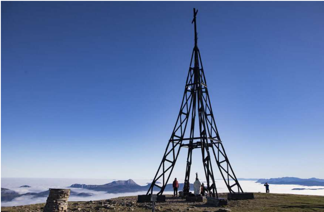
Cruz del Gorbeia

La marcha continúa por la lomada que en días de niebla se hace imprevisible. La pendiente se mantiene invariable cruzando los mojones que indican las mugas entre Orozko , Zuia y Zeanuri , que es el lugar de mayor altitud de Orozko . La punta de la cruz del Gorbeia aparece en el horizonte herboso.