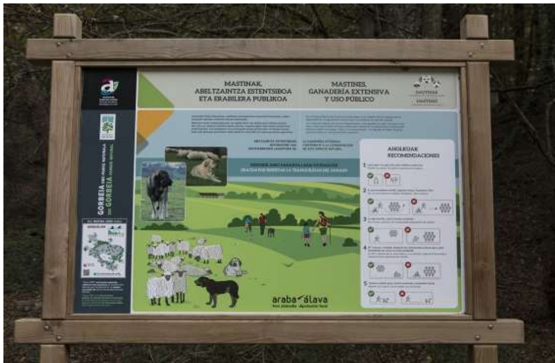
Panel informativo del Parque Natural de Gorbeia

Localidad situada al Noreste del valle de Zuia , a 3 km de distancia de Murgia , siendo el pueblo de mayor altitud del municipio así como de toda la comarca Estribaciones del Gorbea . Su emplazamiento es inmejorable para divisar una panorámica amplia sobre los valles de Zuia , Zigoitia y algunas zonas de Legutiano , razón por la cual, en la antigüedad se construyeron dos Casas Torres ( Zárate y Rodríguez de Mendarózqueta ) de las cuales quedan hoy en día una parte de los edificios. Actualmente cuenta con una población de 32 habitantes, cuya dedicación mayoritaria es la ganadería.