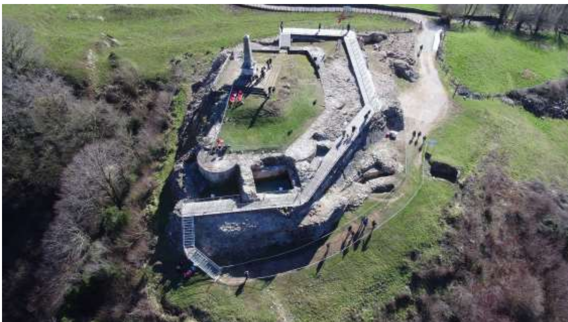
Castillo de Amaiur

Ver Amaiur Arkeologia Zentroa (abierto domingos de 11 a 14 horas)