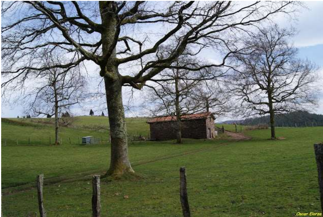
Borda en Irazako lepoa