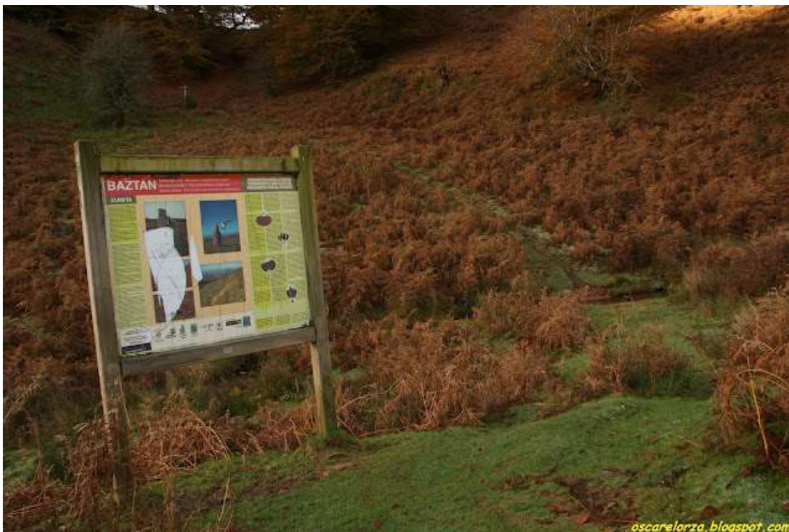
Panel informativo en Zureta

Para llegar desde la cima de Alkurruntz a la localidad de Amaiur , hay que afrontar la fuerte bajada por la ladera Sur, por la roca de Roldan , que cuenta la leyenda la lanzó desde este monte hasta el Gorramendi , pero cayó aquí y hasta la pista de Otsondo a Alkurruntz , en Zureta , donde hay un gran cartel informativo, con marcas verdiblancas de un SL . La cima de Bentarte (823 m.) queda cercana a pocos minutos, y puede ser una ascensión facultativa para coleccionistas de montes.