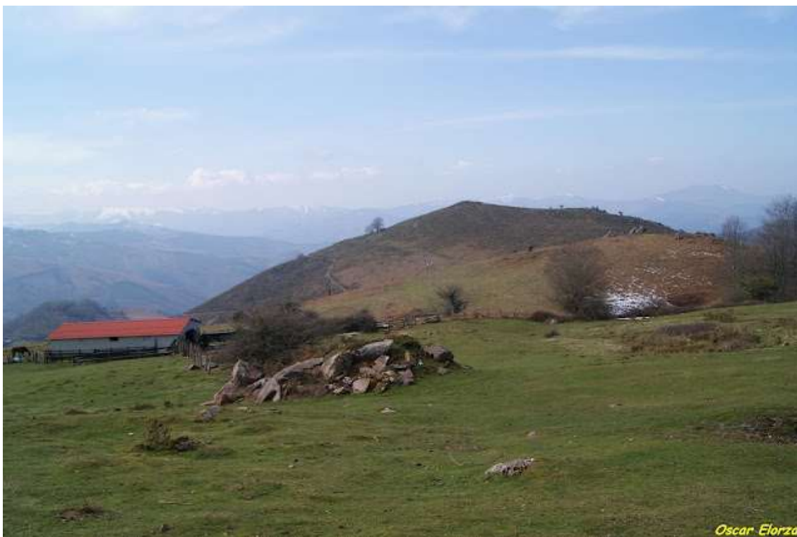
Borda en el collado de Elordi con Madariko gaina al fondo

El camino sigue ascendiendo hasta toparnos junto a una borda y un poste indicador, con el sendero GR-11 que va a buscar el puerto de Lizarrieta . Tomamos a la derecha ( Suroeste ) el ancho camino que gana el collado de Elordi .