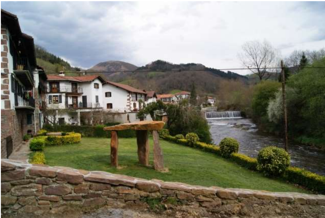
Barrio de Antsolokueta junto a Tximista erreka

Desnivel en ascenso: 937 m Desnivel en descenso: 752 m Tiempo estimado: 5h.15m. Cota máxima: 934 m. Cota mínima: 98 m. Distancia: 19,2 km.