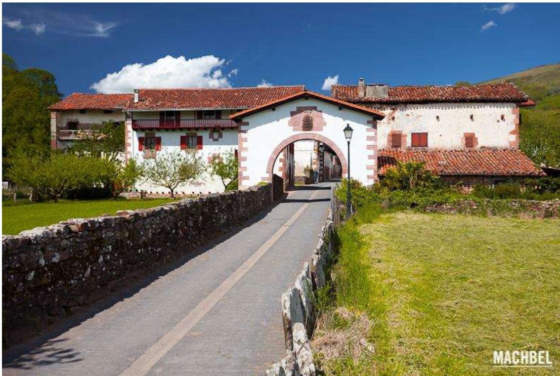
Arco de entrada en Amaiur

Es la localidad más septentrional del Valle de Baztán . Ubicada bajo la vertiente Suroeste del macizo de Gorramendi y bajo la vertiente Sureste del macizo de Alkurrunz , Amaiur queda cerrada al Norte por los montes de Otsondo mientras que por el Sur se abre hacia el cuartel de Baztangoiza , uno de los cuatro cuarteles en los que se divide el Valle de Baztán y al cual pertenece junto a las localidades de Erratzu , Arizkun y Azpilkiueta . Claro ejemplo de pueblo-calle, sus casas fueron construidas a la vera del Camino de Santiago , el cual cabe recordar, atraviesa la localidad. El conocido como Camino baztanés , es una de las variantes del Camino de Santiago y desde Baiona alcanza Iruña siendo, allá por la Edad Media , una de las rutas más utilizadas por los peregrinos, además de por mercaderes o incluso ejércitos. Sobre los tejados de la localidad destaca en la cima de la pequeña colina de Gaztelu (366 m.) el monolito en recuerdo de los navarros que opusieron resistencia en aquel intento de reconquistar el Reino por parte del rey Enrique y en el que estos defendieron el castillo que coronaba este pequeño otero en uno de los episodios más importantes de la historia de Nafarroa .