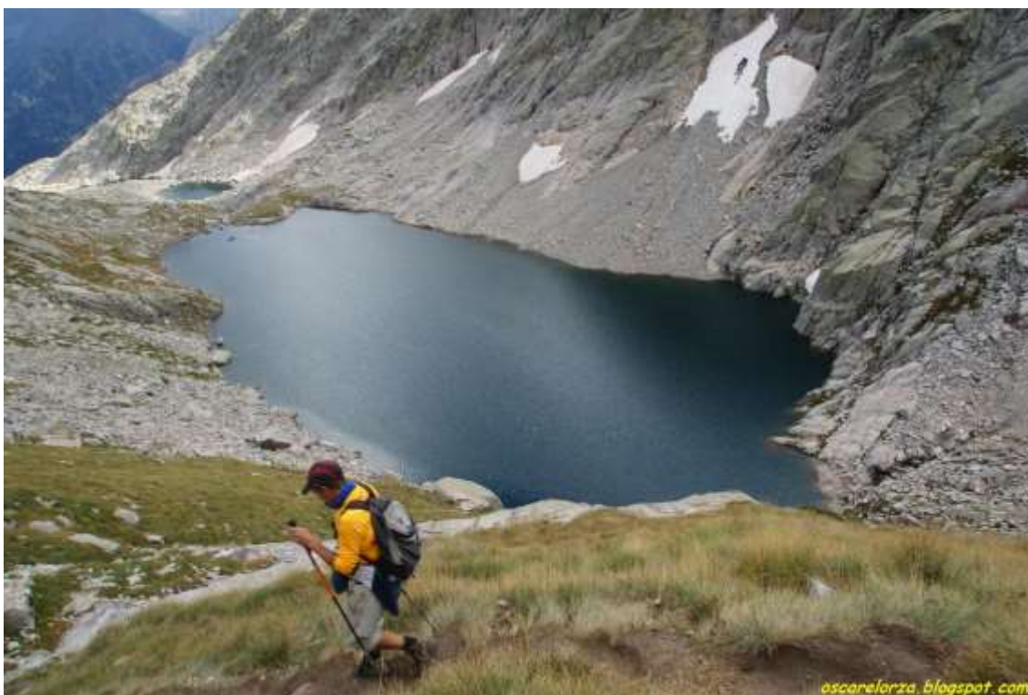
Estany Superior de Mulleres

A la altura de este tercer lago ( el más grande de este itinerario ), comienza una firme subida: el camino es bastante claro y el único problema será interpretarlo correctamente, a pesar de que encontraremos hitos por todas partes. La hierba escasea cada vez más, cediendo el protagonismo al granito, ya sea en forma de cascajo o de grandes bloques. Con todo, iremos ganando cota con el collado en el punto de mira de nuestra progresión.