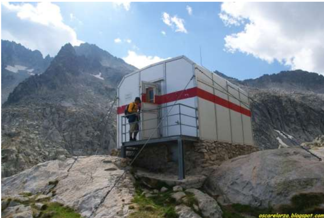
Refugio de Mulleres

Un refugio de emergencia de 12 plazas nos queda algo elevado a la derecha ( Norte ) afianzado encima de un promontorio granítico entre las cada vez más escasas porciones herbosas.