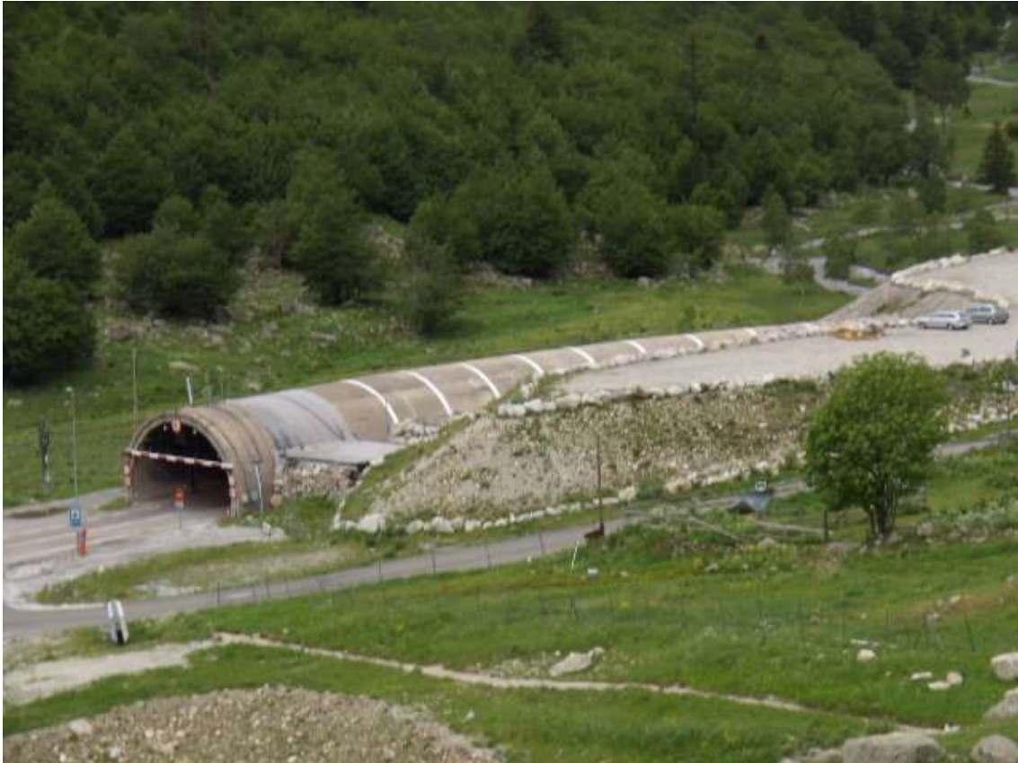
Boca Sur del túnel de Vielha (viejo) y parking

exclusivamente para el paso unidireccional de mercancías peligrosas y como galería de evacuación del nuevo Túnel de Vielha . La boca Sur del Túnel de Vielha se encuentra a una altitud de 1.593 metros, en el barranco de Mulleres , y la boca Norte se encuentra a 1.396 metros, en el Barranc deth Pòrt . El nuevo Túnel de Viella-Juan Carlos I se inauguró en 2.007, sustituyendo al antiguo Túnel de Viella-Alfonso XIII que se inauguró en 1.948.