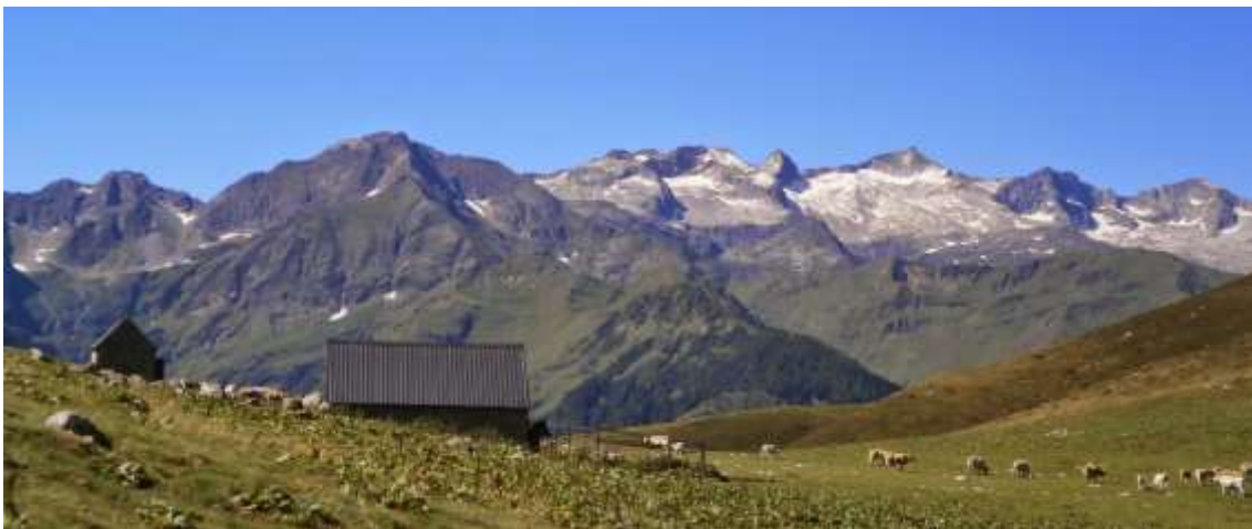
Col de Baretja

Seguir las balizas, que acortan sensiblemente el trazado prolongación de la pista. Fuente abrevadero. La senda asciende por pendiente suave y alcanza el puerto, que es límite con el territorio francés. Conforme nos acerquemos al collado se irán abriendo impresionantes vistas del cordal fronterizo por el Sur, con el glaciar de las Maladetas y la silueta de un buen puñado de tresmiles adornando el horizonte. Final de la pista forestal.